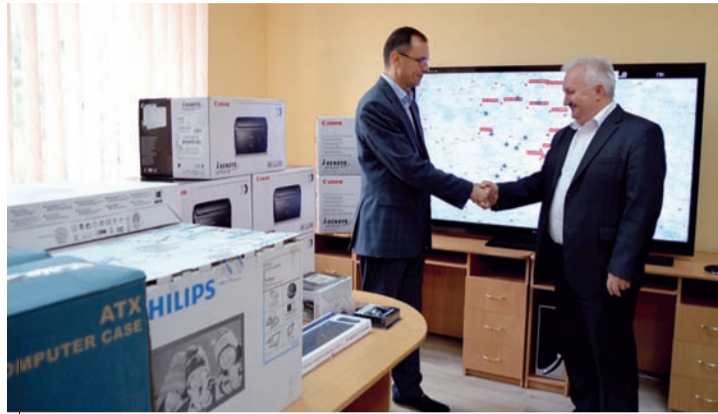
Передане обладнання вже незабаром буде апробоване та працюватиме у центрі екстреної медичної допомоги та медицини катастроф

Аби ця комунікація була ще швидшою, центру потрібне було відповідне комп'ютерне забезпечення. Воно допоможе полегшити роботу диспетчерів, покращить передачу інформації між бригадами екстреної допомоги та найголо-