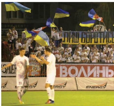
На тлі поразки «Волині» від «Зорі» у 10-му турі найскрасішими спогадами від матчу залишаться емоції вболівальників, особливо фанатського сектору. На початку гри 17-й сектор вивісив банер із промовистою назвою «Лиш боротись – значить жити». Утім поезію Івана Франка краще взяли на озброєння супротивники «Волині».

Гості дуже динамічно розпочали гру, і в перші хвилини наші захисники просто не встигали за переміщеннями візаві. Відчувалася переконливість «Зорі», і тільки у кінці другої десятихвилинки лучани відтіснили