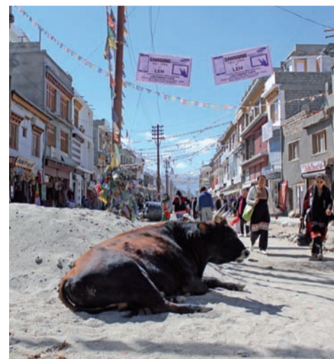
Звичайна картина міста Лех, центру Ладакху, частини штату Джамму і Кашмір, який ще називають «малим Тибетом» через схожість природи

вірне. Я поняття не маю, як вони їздять. Усі сигналять. Це в них і «привіт», і «дай дорогу», і «пропусти»... Спочатку це дуже дратувало. Якби українця кинути в центр Делі, виїняти з вух навушники, то він не знав би, куди йому тікати. Мало того, що рух правобічний, то усі ще й сигналять. Тук-тукі, мотоциклісти, велосипеди, корови, авто – це все видає якийсь звук і кудись їде. Але хай як дивно, я не бачив жодної аварії.»