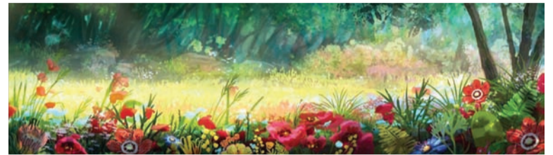
Концепт-арт до майбутнього анімаційного фільму «Мавка. Лісова пісня» від студії «Animagrad»

важливої фабрикантки, яка охоплена бажанням підкорити природу й зберегти вічну молодість. У її арсеналі – дивовижні механічні розробки. На боці ж Мавки – сила природи, її міць і гармонія. Лукаш опиниться між двох вогнів. Він муситиме зробити вибір між Килиною і Мавкою.