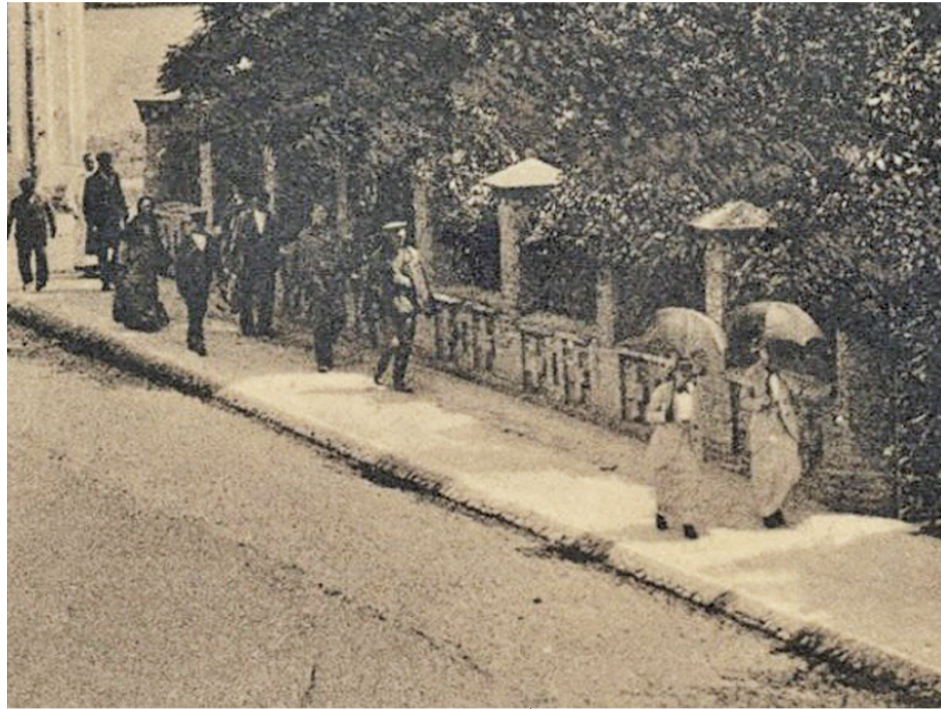
Вулиця Шосейна. Біля міського саду.

в руках, а супроводжували їх чоловіки з циліндрами на головах.