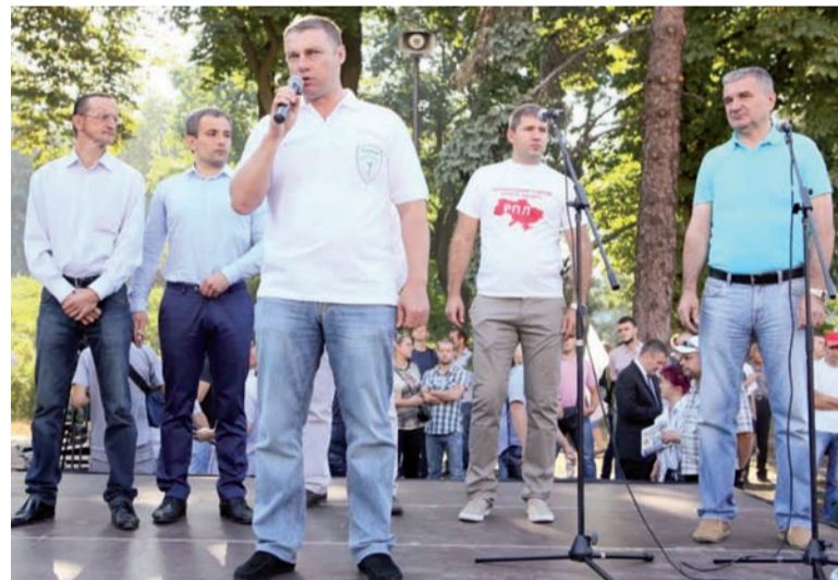
Депутат Верховної Ради Віталій Купрій, один з лідерів УКРОПу, вважає, що змінювати Конституцію у воєнний час є злочином проти держави і її громадян

«Я зустрічався з громадськими активістами по всій Україні, і ніхто не розуміє, навіщо зараз, під час війни, коли російський агресор намагається придушити нашу державу, змінювати Конституцію. Багато людей вважають це державною зрадою, бо тут відслідковується інтерес Путіна», – сказав Віталій Купрій під час мітингу «Зміна Конституції – право народу», організованого УКРОПом під стінами Верховної Ради.