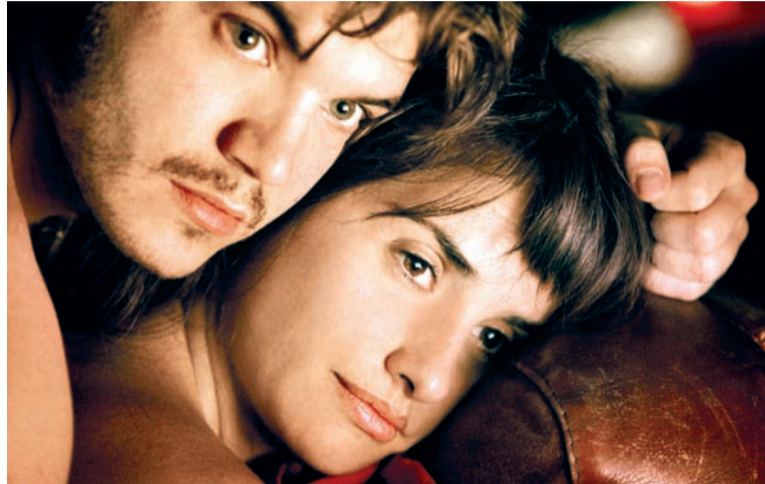
Фільм із Пенелопою Крус не зібрав численних нагород, але номінувався на найпрестижніших європейських фестивалях в Сан-Себастьяні та «Гойя». Пенелопа вирішила обрати стрічку режисера Серджіо Кастелліто після того, як їй сподобалося працювати у драмі «Не йди» (2004 р.)

Хоча стрічка не про війну, вона виступає тільки фоном, обрамленням сюжету. Головна ж тема тут – це війна внутрішня. Дія розвивається у ретроспективі. Стрічку знято на стику минулого й теперішнього, які постійно перехреснюються між собою.