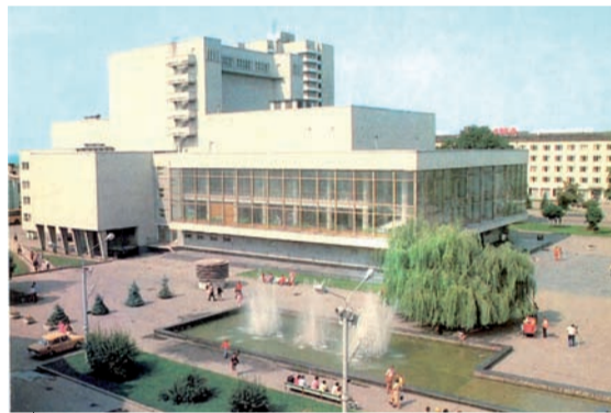
Ось таким пам'ятають головний фонтан міста із середини 70-х

За словами тодішнього головного архітектора