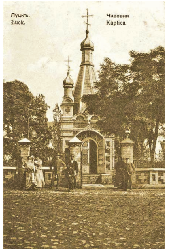
Мощення вулиці Лесі Українки у другій половині XIX століття