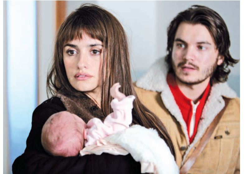
Ближче до фіналу глядачу подають такі фрагменти монологів, які змінюють вже сформовану думку на фільм

Ще одна порада – перед переглядом або після нього «погугліть» про Боснійську війну і взагалі Балканські війни 1990-х.