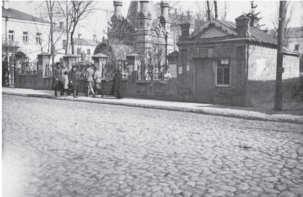
Бруківка на Лесі Українки в 1915 році

Та в XIX столітті цю ситуацію трохи намагалися виправити будівництвом стратегічних магістралей. Одна з них – Києво-Брестське шосе – пройшла через Луцьк. І не просто через Луцьк, а через сам його нинішній центр і пішохідну вулицю – Лесі Українки. Дорогу будували у