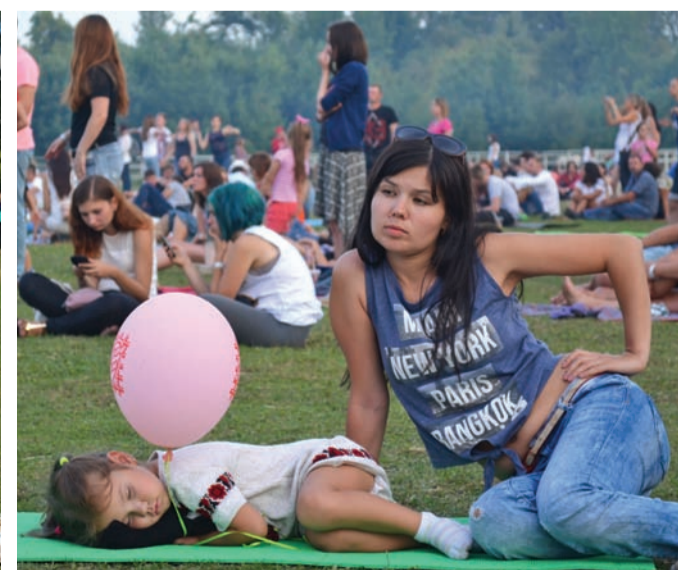
Щороку на фестиваль приходять усе більше батьків із маленькими дітьми