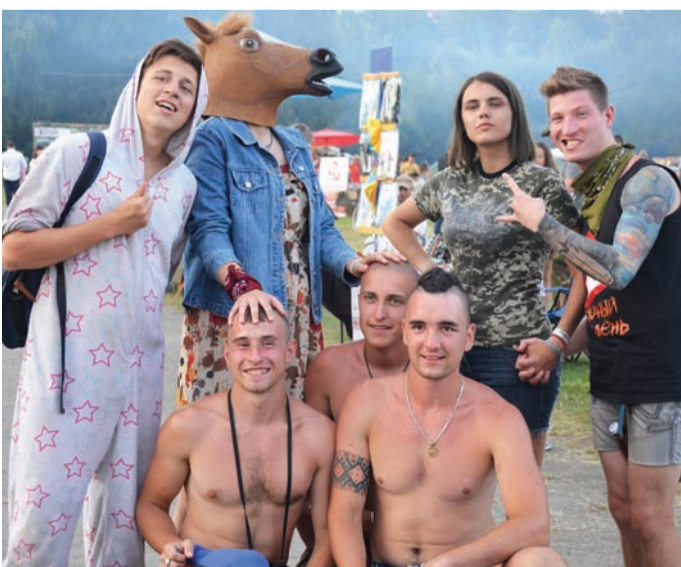
Бандершатівська молодь вигадує найрізноманітніші розваги, однак цілком тверезі, адже тут діє сухий закон