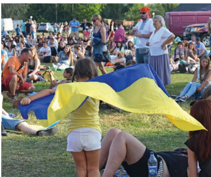
Організатори певні: патріотизм треба виховувати із малечку