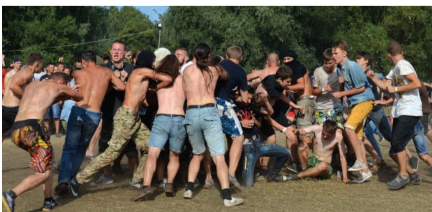
Звичне для рок-концертів брутальне дійство – слем. Утім така штовханина під музику має правила, головне – нікого не травмувати і подати руку тому, хто спіткнувся.