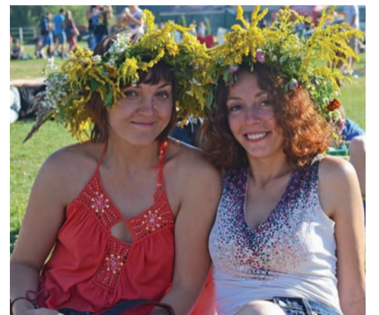
Одні купували віночки на ярмарку, інші ж творили прикраси власними руками із живих квітів