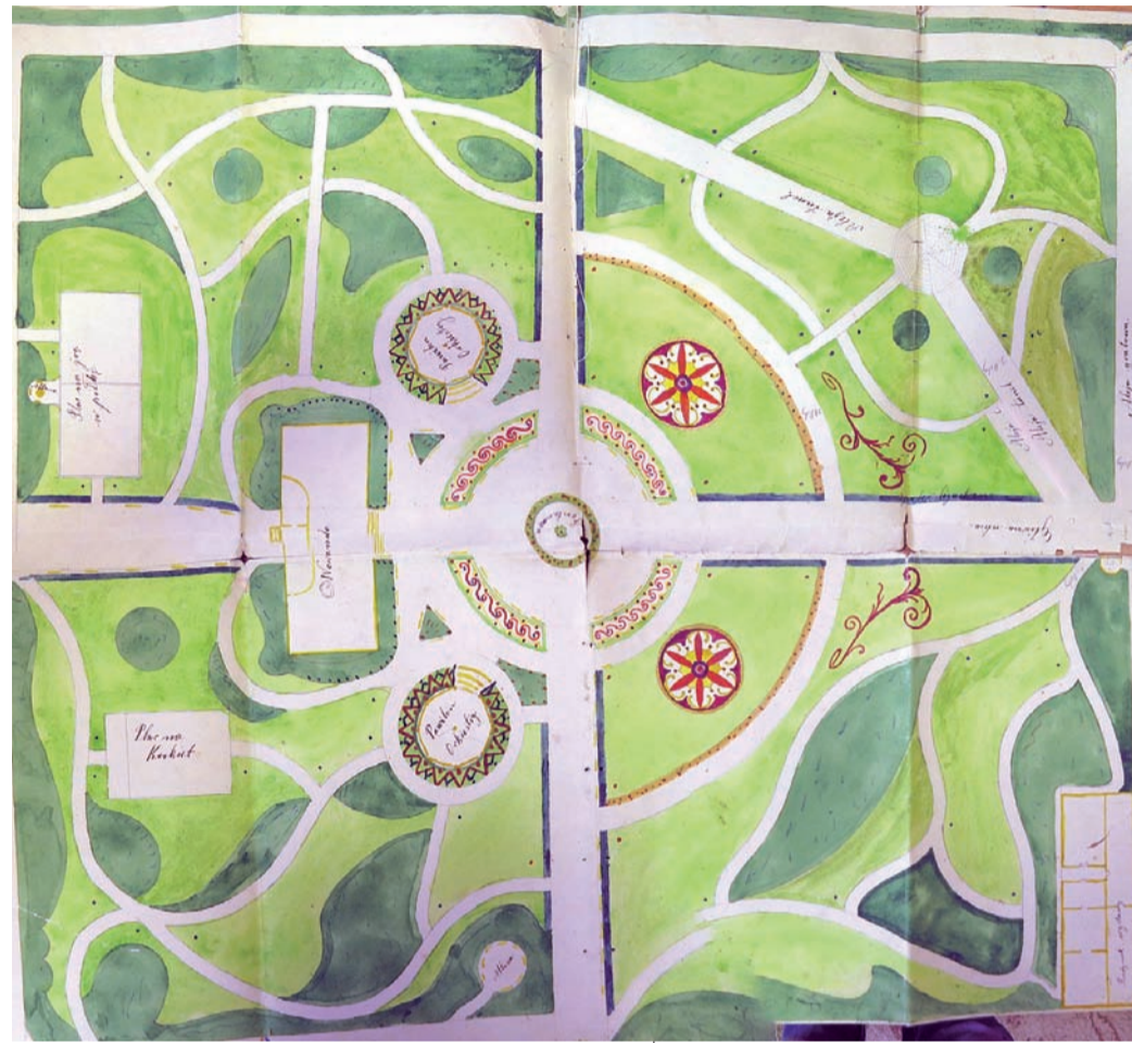
Проект саду в Луцьку невідомого автора

каштан, верба плакуча, липа, оливник, айва, глід, гортензія, тополі, бузок, калина та сила-силенна інших видів дерев та кущів.