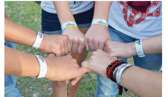
На фестиваль українського духу прийшли гості з усіх куточків України, окупованого Криму й навіть з-за кордону