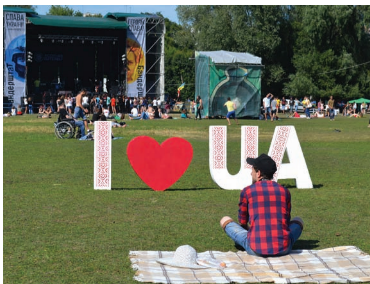
Завдяки «Бандерштату» сотні туристів відкрили для себе Луцьк. Чимало з них – уперше.