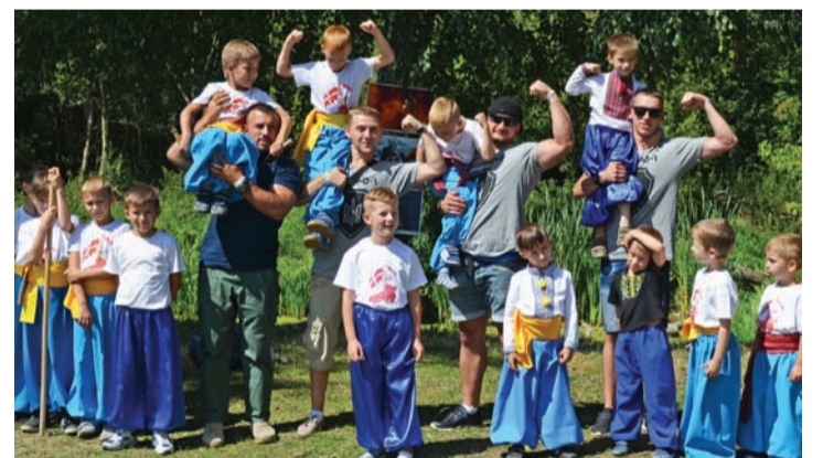
Юні козаки зі школи бойового гопака «Герць» влаштували показові виступи, викликавши неабияке захоплення у відвідувачів