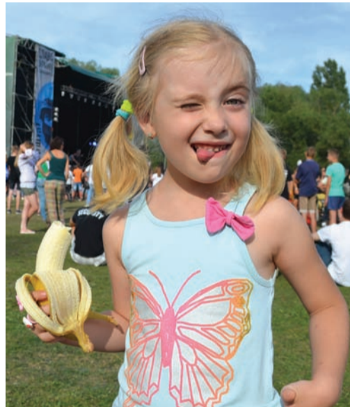
Вхід для дітей до 12 років – безплатний