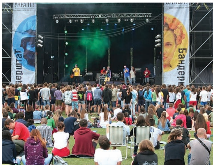
За усі дев'ять років існування фестивалю луцька «ФлайзZза» виступила тут вперше