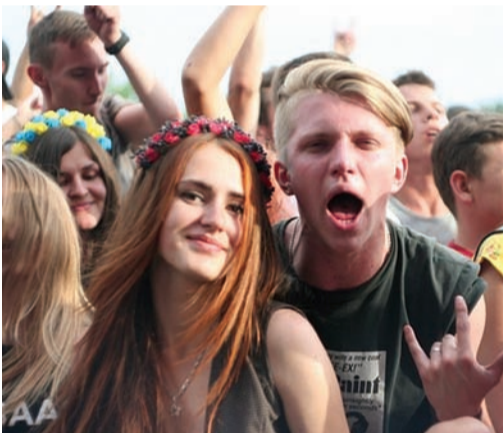
Найемоцінніша пора для фестивалю розпочалася після п'ятої, коли на сцені з'являлися музиканти