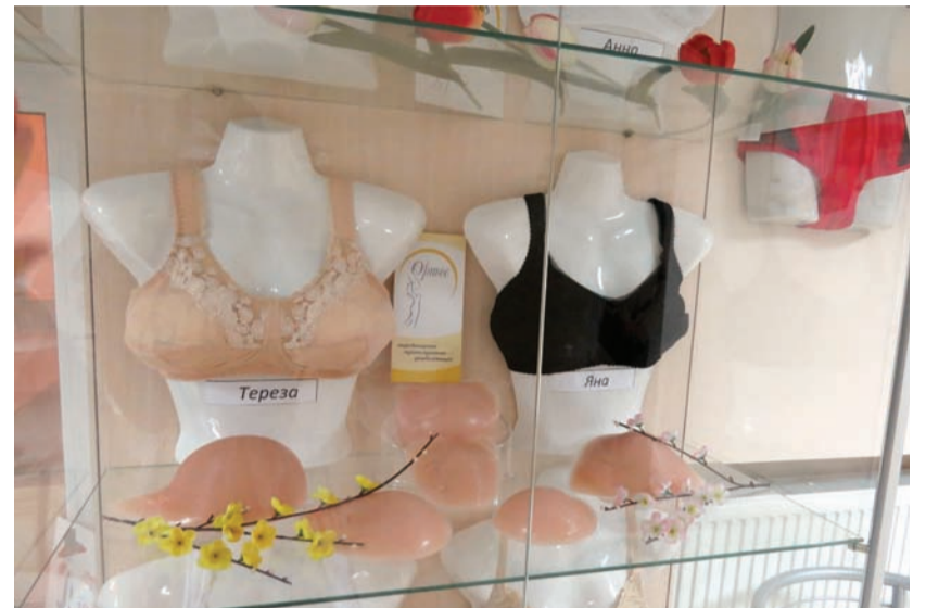
Протези та білизну жінкам надає ТЗОВ «Ортек»