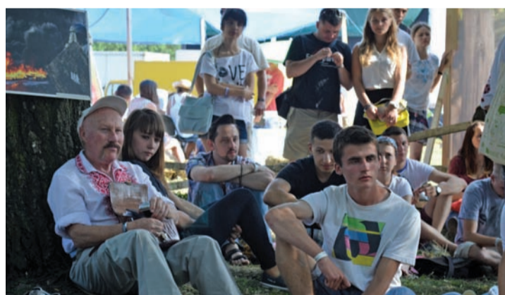
Одна із родинок «Бандерштату» – гуртіки із відомими митцями, громадськими діячами, політиками