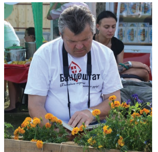
Більшість відвідувачів – молодь, хоча траплялися й люди старшого покоління