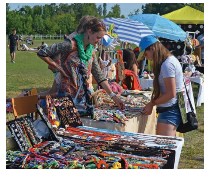
На ярмарку різноманітний патріотичний крам – до кольору до вибору