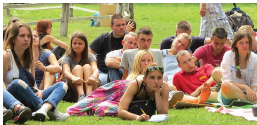
На фесті з року в рік збираються молоді люди, спрагли до знань, відкриттів і самовдосконалення