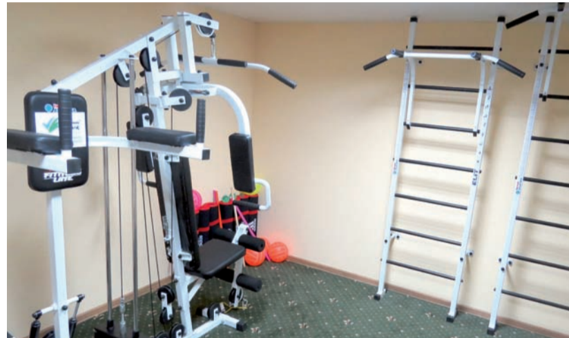
Усе спортивне обладнання Центру надав Фонд. Тренажери дозволяють жінкам займатися на різних стадіях реабілітації

Чому ж так важливо виконувати вправи після операції? Річ у тім, що після оперативного втручання потріб-