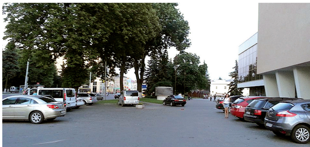
Залишки парку біля театру

Інший приклад трансформації – Театральний майдан. Спочатку він існував як протомайдан, тобто територія біля осідку луцьких бернардинів. Фактично, став використовуватися тільки в XIX столітті як полігон для військових. Наприкінці століття тут