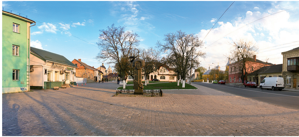
Майдан Ринок сьогодні

Сьогодні це просто історичні об'єкти, які ніяк не відображають пам'яті того, що тут було раніше. І це дуже показово, якщо ви зайдете на територію Окольного замку. Ви ніколи не скажете, що тут був замок. Місто стерло пам'ять про це. Тобто ні візуально, ні ментально ви ніяк не зрозумієте, що це замок, який насправді збережений на 50%. Це, здавалося б, сенсаційно: половина замку є, а ніхто його не бачить. Не бачить тому, що й про інші замкові об'єкти місто втратило пам'ять. Це і становить суть пам'яті