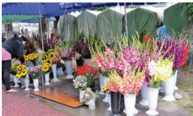
У перспективі квітами мали б торгувати у підземному переході

вий ринок, нарікали на сміття від продавців.