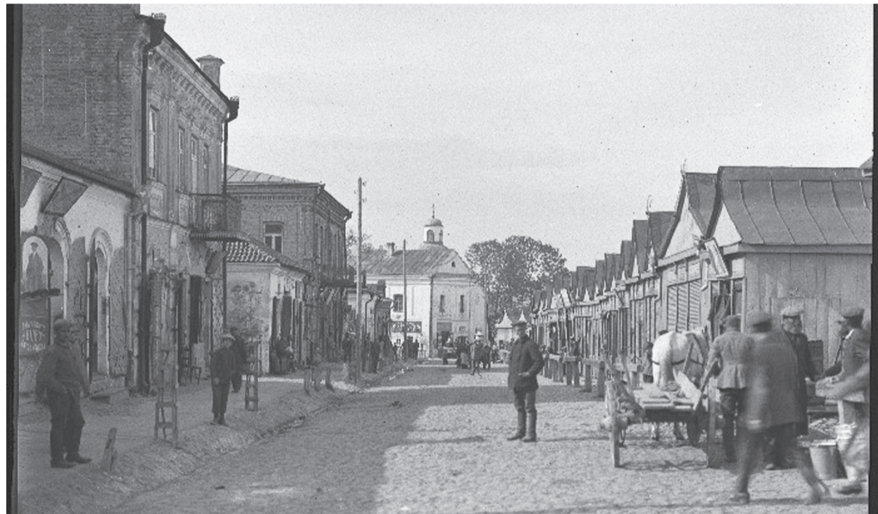
Майдан Ринок у 1925 році

МІСТО, ЯК І ЛЮДИ, МОЖЕ ВВАЖАТИСЯ ЗДОРОВИМ ТОДІ, КОЛИ ВОНО НЕ ХВОРІЄ НА АМНЕЗІЮ