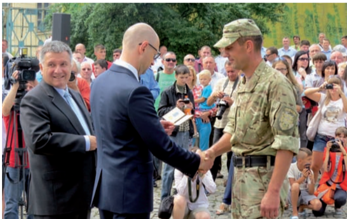
Солдати отримали нагороди