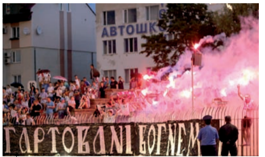
Ультрас «хрестоносців» підготували новий флеш-моб на відкриття сезону – на 17 секторі «підпалили» вислів «Гартовані вогнем»

«Говерла» – «Ворскла» 1:1, «Карпати» – «Сталь» Д 1:0, «Динамо» – «Олімпік» 2:0, «Зоря» – «Металіст» 0:0, «Олександрія» – «Металург» 3 1:0, «Дніпро» – «Чорноморець» 4:2.