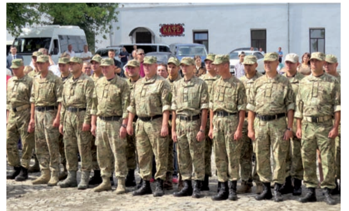
Бійці спецпідрозділу «Світязь»