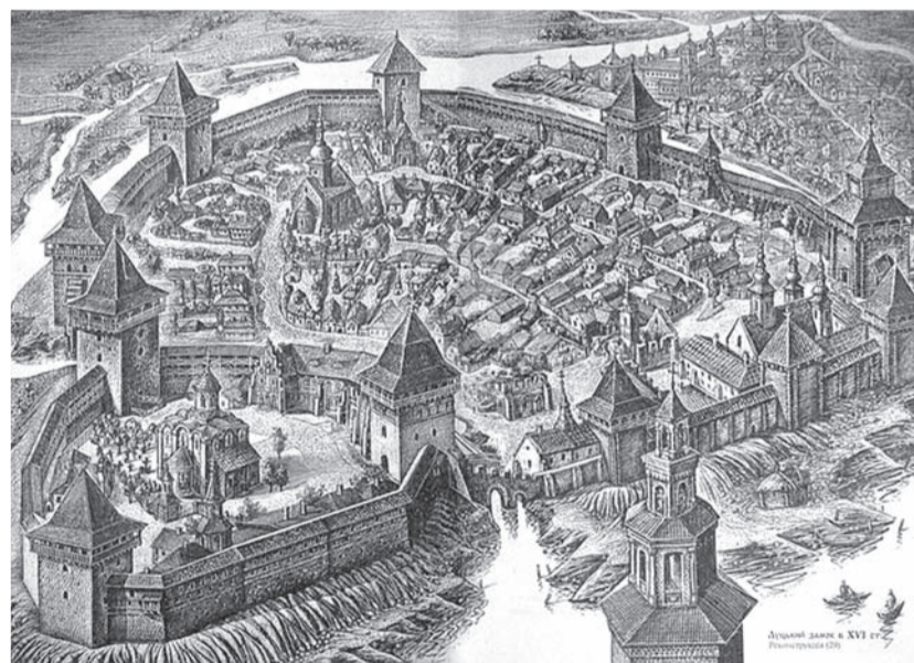
Верхній та Окольний замки у XVI столітті

міста – не проста наявність інформації про історію замку і навіть не наявність реліктів тієї історії, а наявність певної сутності об'єкта, яка вплетена в сучасність міста. Окольний замок має жити і використовуватися – тоді він відіграє значення для пам'яті міста.