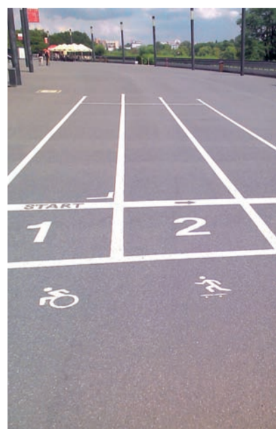
Навколо стадіону прокладено кілометрову трасу, якою послуговуються бігуни, скейтбордисти та інваліди

Біля центрального входу найбільшого стадіону країни Казімежа Гурського увіковічили у бронзі.