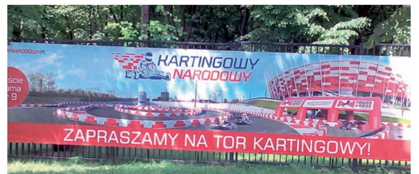
«Народовий» часто не так стадіон, як мистецько-розважальний об'єкт