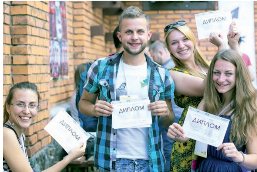
Після завершення арт-хакатону учасники команд отримали дипломи за активну участь у дійстві

Акція тривала два дні – 17 та 18 липня. Суть – змотивувати команди висунути ідеї для покращення простору міста. Відбувалися також виступи різних людей на теми, дотичні до поняття міста. Так, перший заступ-