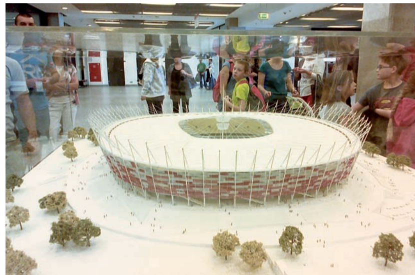
На стадіоні організовано п'ять видів тематичних екскурсій

позаростали кущами, а сам стадіон використовували як ринок. Причому то був мегакриміналізований базар, яким заправляла в тому числі українська та російська мафія.