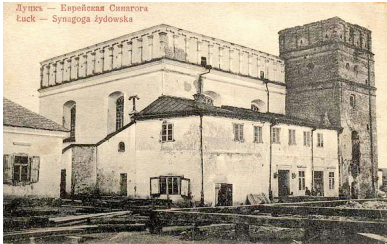
Луцьк — Еврейская Синагога Lutsk — Synagoga żydowska