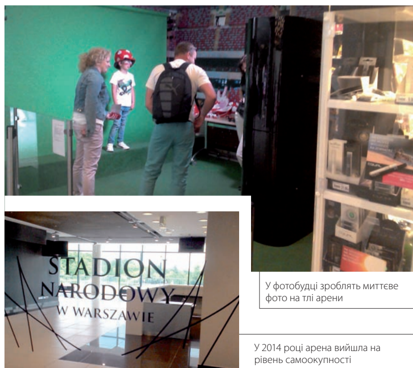
У фотобудці зроблять миттєве фото на тлі арени