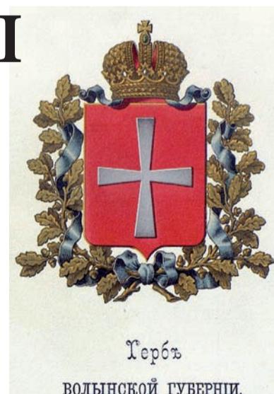
Герб Волинської губернії у XIX столітті

Незважаючи на австрійську окупацію 1915 – 1916 років, Волинь і далі жила за адмінподілом Російської імперії. Між третім поділом Польщі наприкінці XVIII століття і часами УНР землі об'єднувалися у Волинську губернію. Її центром був Житомир, а територія ділилася на 12 повітів. Російською мовою повіт називався «уезд». Луцьк був «уездным городком» поряд з Володимиром-