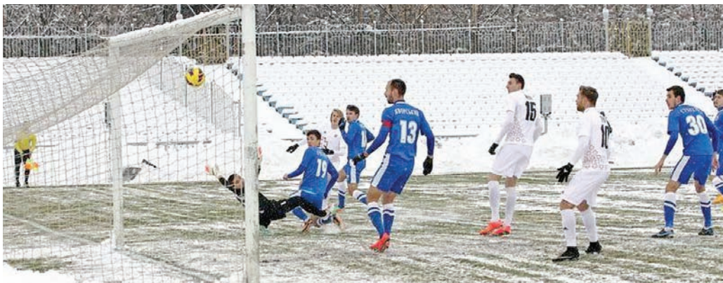
У хокей зіграли справжні чоловіки