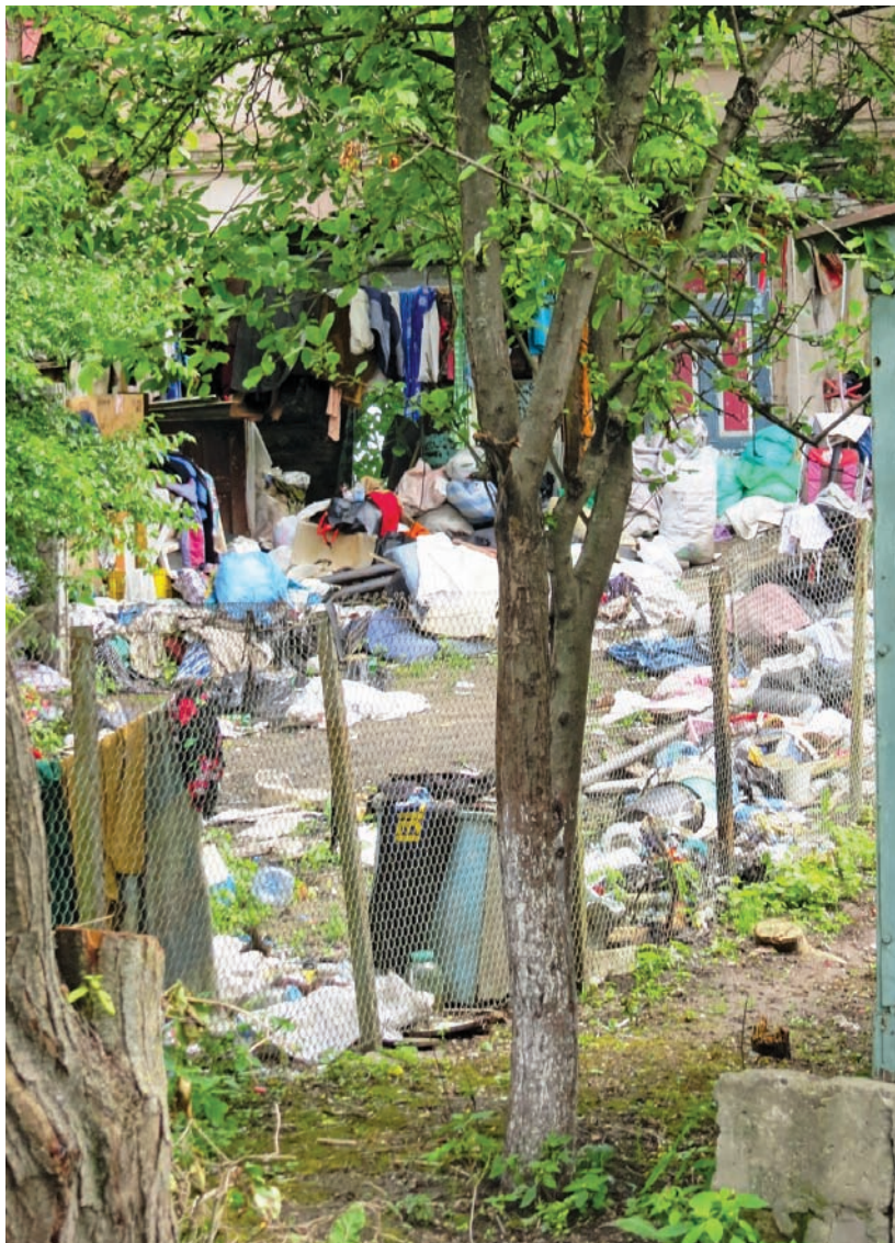
Подвір'я «жінки Плюшкіна»

Типовою неприємністю, яку створюють одне для одного сусіди, є порушення правил тиші. Відповідно до українського законодавства (ЗУ «Про забезпечення санітарного та епідемічного благополуччя населення») у нічний час із 22:00 до 8:00 у житлових