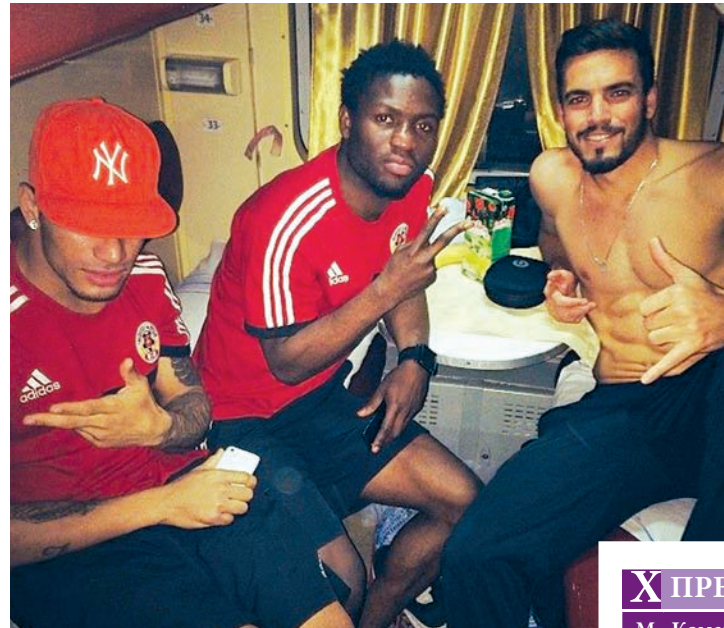
Те саме фото із потяга Київ-Донецьк. Хто там наступний? «Іллічівець»? Ми вже запрягаємо воза!..