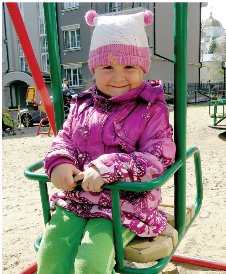
Трирічна Маринка бавиться, поки мама клопочеться оформленням документів. Малеча й не підозрює, що доля занесла її так далеко від дому...

на. Але вона поки не здогадується, яке випробування постало перед її мамою. Хтозна, може, й до Криму ми більше ніколи не повернемося. А так хотілося б, щоб усе стало на свої місця.