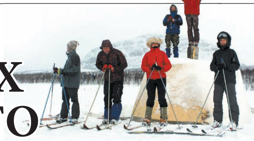
Біла тиша і неймовірні пейзажі Фінляндії

твоїєї групи, на відстані щонайменше 70 кілометрів навколо немає нікого. Час до часу лише зустрічаєш когось. Мобільний чи інтернет-зв'язок там недосяжний.