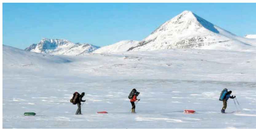
Кожен із команди мав 30-40 кг вантажу

– Різні думки лізуть в голову. Зазвичай я просто милуюся красою, величними масштабами природи, недоторканістю. Зрештою, починаєш собі помаленьку розуміти, де ти є і як далеко від дому. А це було більш як 2,5 тисячі кілометрів від Луцька. І ще ти розумієш, що, окрім