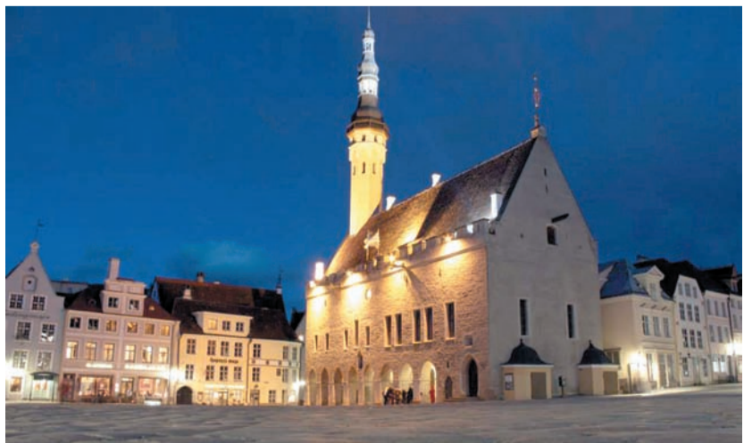
Вечірня центральна площа Таллінна

– Туристів було небагато, хоча цей маршрут популярний. Є такий шлях,