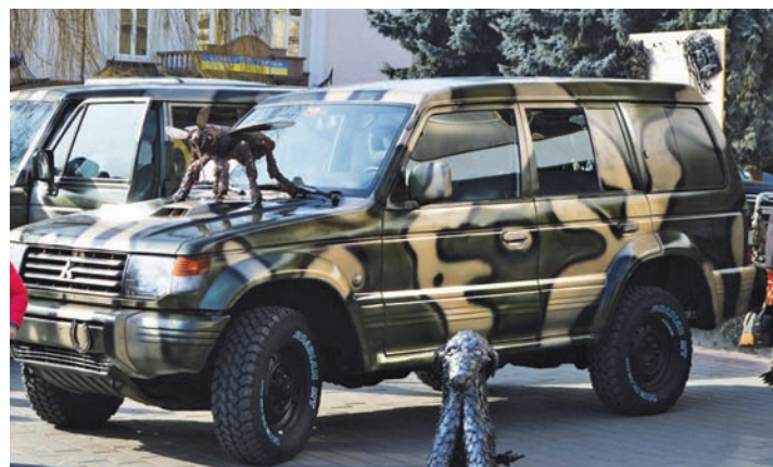
Переобладнаний позашляховик вирушив у зону АТО

Роботи коваля згодом зможуть побачити всі очі. Де саме буде розміщено колекцію, Фонд повідомить згодом.