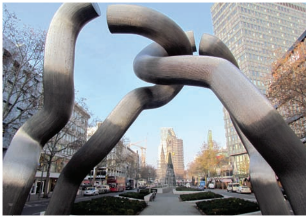
Пам'ятник роз'єднано-єдиній Німеччині. На нього надбав у серці колишнього Західного Берліну – на Кюрфюхенштрассе.

• На берлінських світлофорах помітив кумедних чоловічків. Це – «Ампельмани». Психолог Карл Пеглау отримав у 1961 році завдання від міністерства транспорту НДР розробити спосіб регулювання руху, який знизив би кількість ДТП. Він придумав «Ампельманна». Після об'єднання всі символи НДР видаляли. Взятися й за «Ампельманна», який не відповідав стандартам ЄС. Але акції протесту змусили владу залишити його! Крім чоловічка, помітив, що шлях водіям і перехожим інколи вказує на світлофорах ведмедик – символ Берліна (один з варіантів назви міста від Bär – ведмідь).