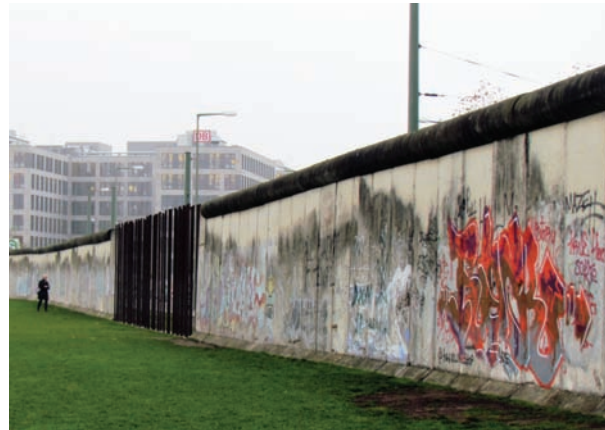
У кількох місцях Стіну залишили для туристів і тих німців, які потрохи забувають надбання НДРівської епохи