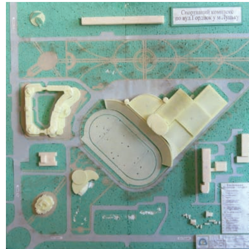
Такий вигляд мав мати гуртожиток і спортядро за першим варіантом проекту. Але цей варіант не вдалося реалізувати.