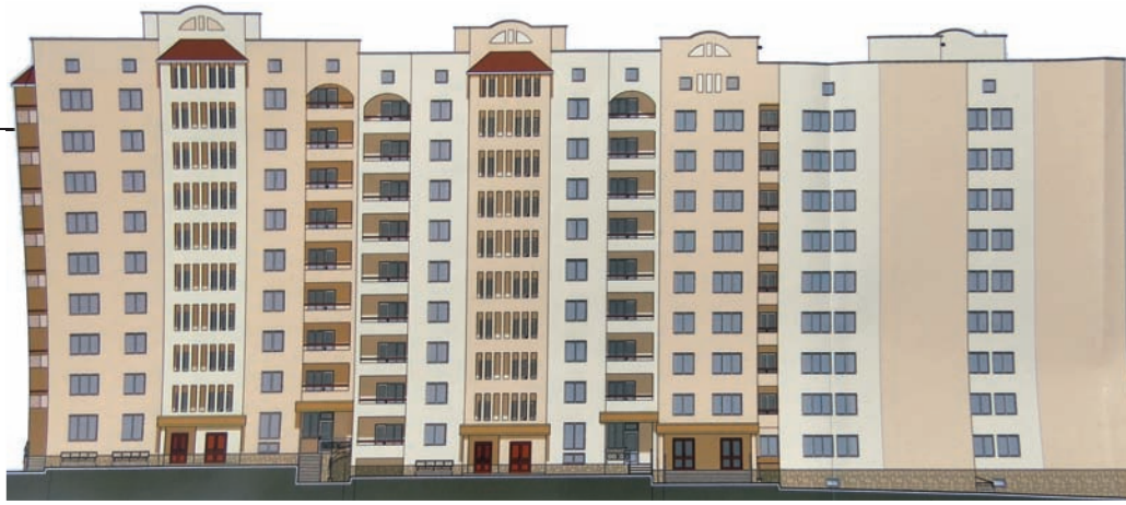
Проект майбутнього гуртожитку.