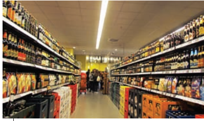
110 сортів пива

ЩО Я НЕ ЗНАВ ПРО БЕРЛІН АБО ТІЛЬКИ ЗДОГАДУВАВСЯ?