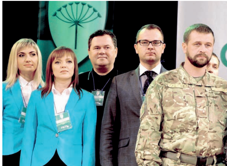
Серед волинських укропівців – військові, волонтери, чинні депутати і чимало молодих людей, які ніколи раніше не були в політиці.